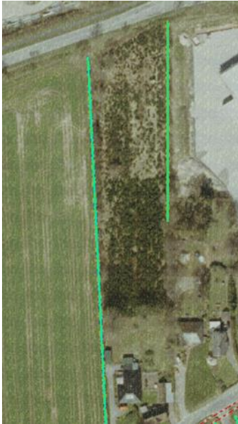
Abb. 1: Nadelwaldbestand mit randlichen Knickstrukturen

Gem. des entsprechend anzuwendenden Erlasses „Durchführungsbestimmungen zum Knickschutz, Erlass des MELUND – V 534-531.04 vom 20.01.2017 haben sowohl die Knicks als auch die ihnen vorgelagerten Schutzstreifen im Innenbereich bestimmten qualitativen Ansprüchen Rechnung zu tragen (Überführung der Knicks in öffentliches Eigentum und Gewährleistung einer einheitlichen und dauerhaften Pflege inkl. der vorgelagerten Schutzstreifen).